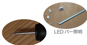
工具の先端でスクラッチする